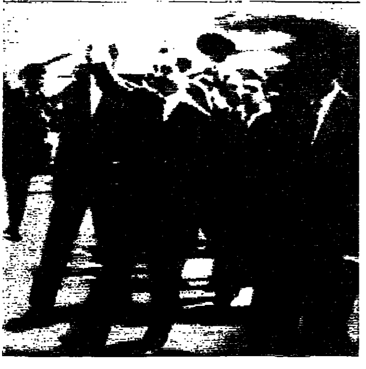
جلالة الملك العظيم في مطار كراشي يلوح بيده بوعدا وخلف جلالتهم سمو الأمير حسن ولي العهد العظيم